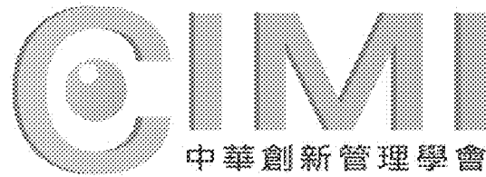
Figure 1. The CIMI logo